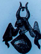
Slægten Stures våben: enavid stor med røde finner på blå baggrund.

Die Burgruine "Helvedgård" ist der Überrest einer Burg aus dem Mittelalter. Das genaue Alter ist nicht bekannt, wahrscheinlich stammt sie jedoch aus dem 14. Jahrhundert. Die Wirtschaftsgebäude lagen auf Land. In dem 16. Jahrhundert wurde "Helvedgård" als Herrensitz aufgegeben.