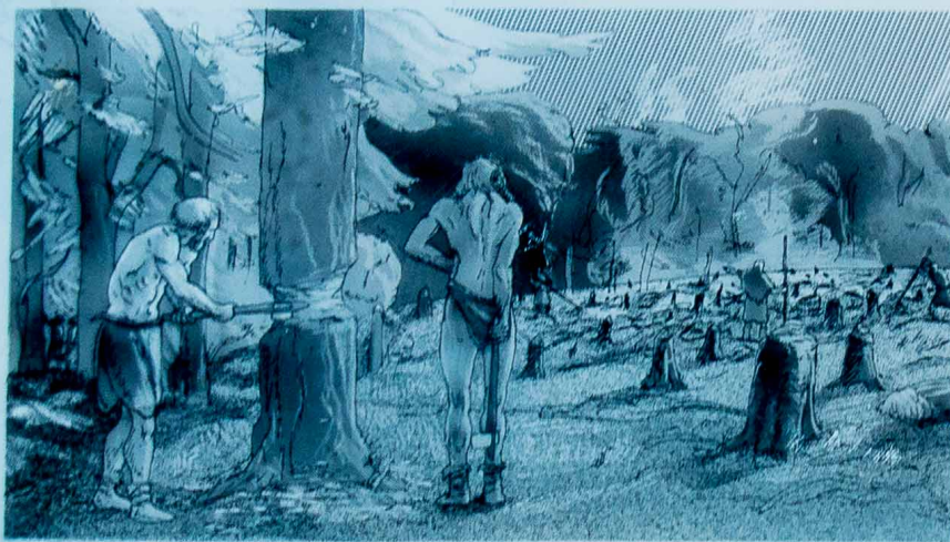
Dysselidens agerbrug var et svedjebrug. D.v.s. at inden man såede f.eks. korn, fældede man et stykke skov og brændte det tiloversblevne kvar af.