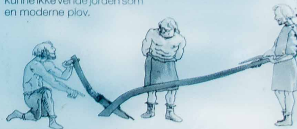
På et tidspunkt fandt man på at forsyne arden med et udskefteligt skær. Derved forbedredes arden holdbarhed betydeligt.

Gråsten statskovedistrikt Miljøministeriet, Skov- og Naturstyrelsen